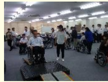
車いすの利用体験