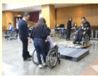
車いすの利用体験