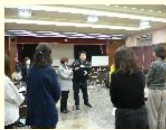
視覚に障害をお持ちの方の誘導法指導