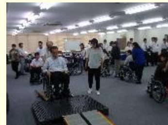
車いすの利用体験