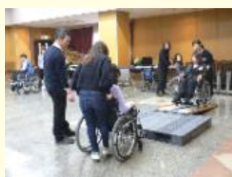
車いすの利用体験