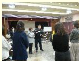
視覚に障害をお持ちの方の誘導法指導